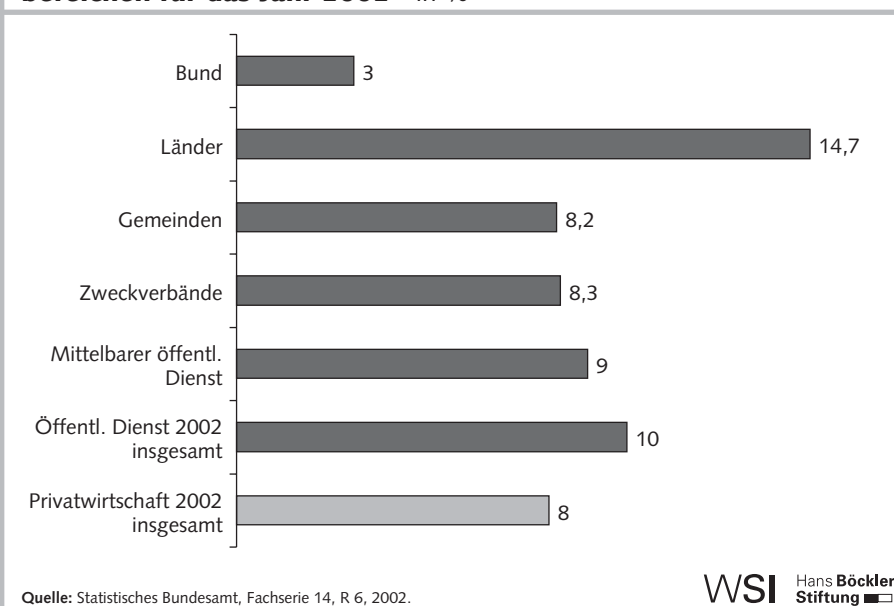
Abb. 1: Befristungsquoten im öffentlichen Dienst nach Beschäftigungsbereichen für das Jahr 2002 - in % -