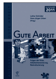
LOTHAR SCHRÖDER/ HANS-JÜRGEN URBAN (HRSG.): GUTE ARBEIT. AUSGABE 2011

Der Band bleibt jedoch nicht bei solchen eher generellen Thesen und Positionsbestimmungen stehen, sondern zeichnet in einem weiteren Abschnitt mit insgesamt sieben Beiträgen zunächst ein facettenreiches Bild der Arbeitsrealitäten und Sichtweisen unterschiedlicher Beschäftigtengruppen und macht zugleich deutlich, wie die Arbeitenden mit ihrer