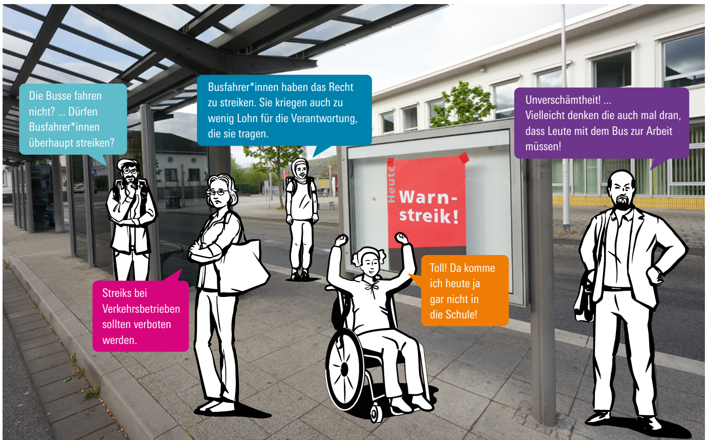
Illustration: explainity®