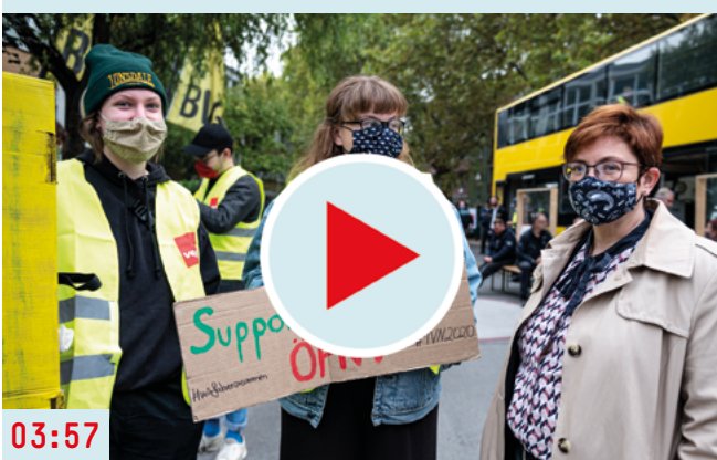
#TVN2020: Wir fahren zusammen (2020) www.youtube.com/watch?v=zm2qw1j4FG0